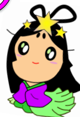
交野市 おりひめちゃん