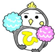
ハローワーク枚方 ひらべんさん