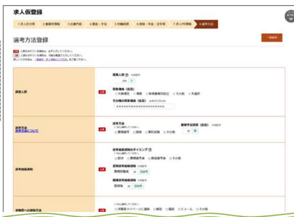
求人申込み（仮登録）の入力画面イメージ