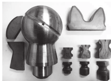
硬化マクロパターン