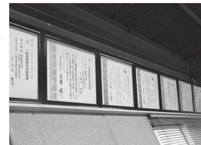
国家資格(熱処理技能士)