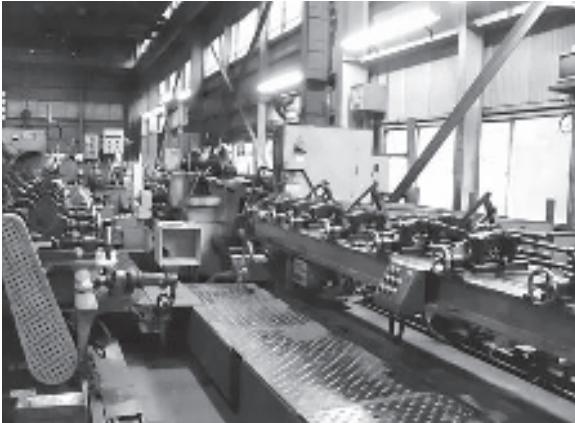
セントレスグラインダー