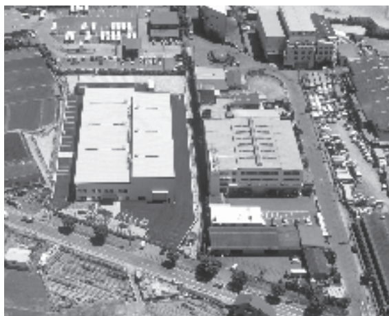
交野第二事業所・交野事業所

産業機械メーカーをしております。 交野と寝屋川に工場、秋葉原に東京支店があります。 合計120人余りの社員の職種は、営業・技術・製造員。 創業以来、シート状のものを保管・加工するために必要な巻取機・スリッター・包装機を製造し、国内外の大手顧客の生産ラインの設備として提供しています。 近年は液晶パネルや太陽光発電など高機能フィルム部材産業の顧客に対応するため、営業活動と社内のコミュニケーションをよりの確に行なえるよう、組織の人材も若返りを図っています。