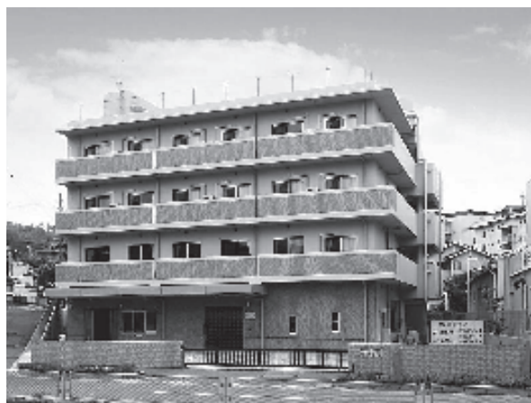
▲サービス付高齢者向け住宅