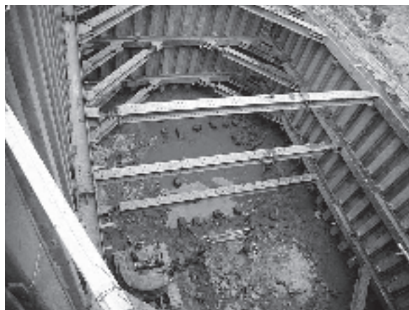
▲橋脚取壊し(切梁、腹起し設置)